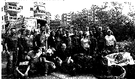
Kpmg Al lavoro per l'ambiente

Per individuare progetti e associazioni ci si può rivolgere alle banche dati di enti come Ciessevi. Per la provincia di Milano www.ciessevi.org . A livello nazionale Osservatorio Socialis ( www.osservatoriosocialis.it ).